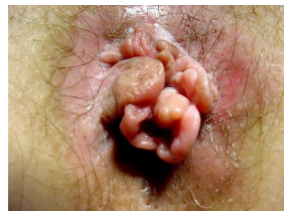
Leicht entzündete Marisken