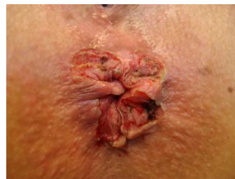
Zustand nach Entfernung der Marisken